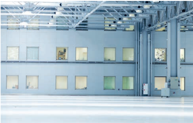
Industriehalle mit MEAVARIO Fenstern

Ein Beispiel sind Stallungen: Rechtliche Vorgaben regeln etwa die Energiestandards bzw. den Lichteinfall bei der Tierhaltung – spezifische Anforderungen, die zuweilen spezifische Lösungen erfordern. Wir bieten unsere Produkte deshalb neben der Standardausführung auch in Sonderanfertigungen an.