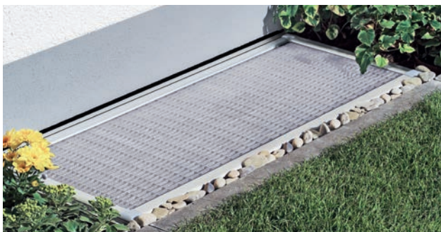
Lichtschachtabdeckungen gibt es optional mit integrierter Belüftung oder als Glasabdeckung zum Schutz vor Fassadenwasser

Unser Produktsortiment verwandelt den Keller in einen Wohlfühlort. Zargenfenster im modernen Design bringen maximales Tageslicht in das Untergeschoss. Kellerlüfter sorgen ganz automatisch für eine ausreichende Belüftung und ein gutes Raumklima. Und eine große Auswahl an Schutzgittern und Abdeckungen halten Lichtschächte sauber und reduzieren den Reinigungsaufwand auf ein Minimum.