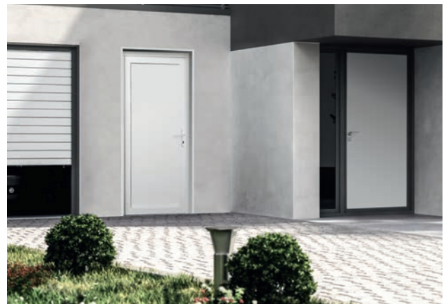
Modernes Einfamilienhaus mit Nebeneingangstür MEAVARIO