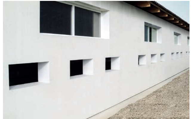
Stallgebäude mit MEAVARIO Zargenfestern und Aussparungskörpern