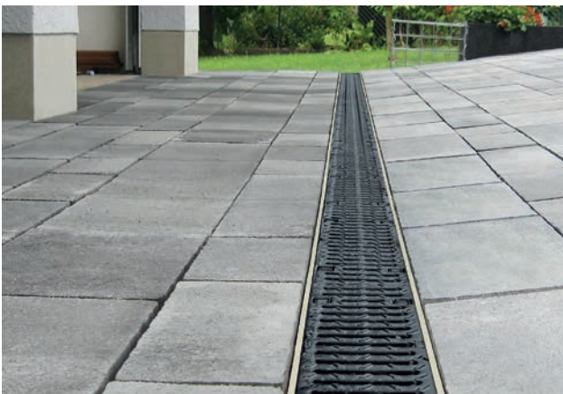
MEARIN Entwässerungsrinne in der Hofeinfahrt